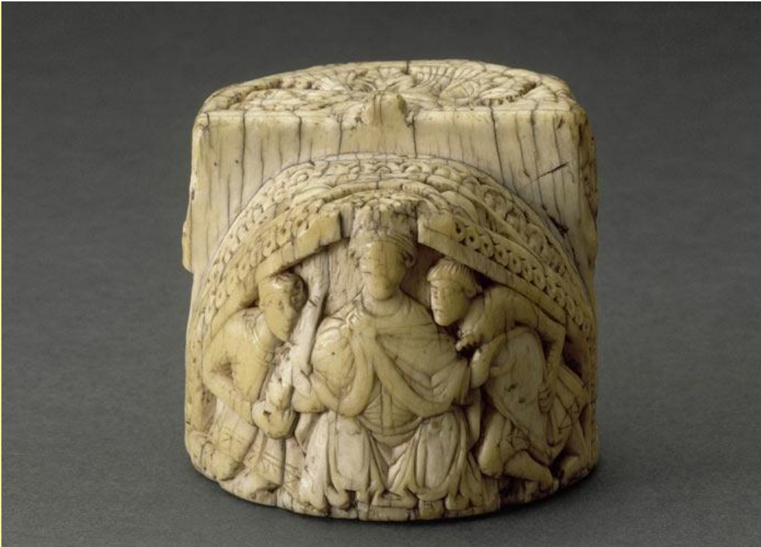
Konge fra 1100-tallet: