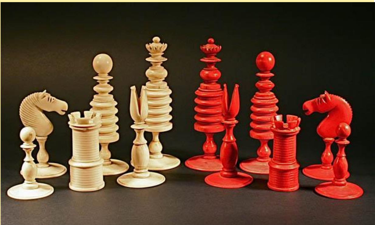
En konge fra starten af 1800-tallet: Den højeste brik: